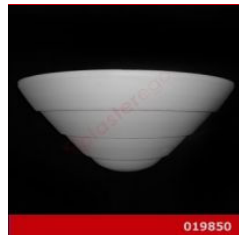
Cod. 019850 - Lampada in gesso Lampada in gesso alabastrino rinforzato.