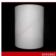
Cod. 0191062 - Lampada in gesso Lampada in gesso alabastrino rinforzato.