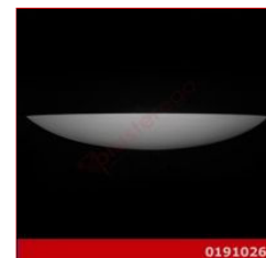
Cod. 0191026 - Lampada in gesso Lampada in gesso alabastrino rinforzato.