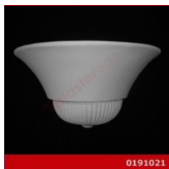
Cod. 0191021 - Lampada in gesso Lampada in gesso alabastrino rinforzato.