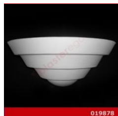
Cod. 019878 - Lampada in gesso Lampada decorata in gesso alabastrino rinforzato.