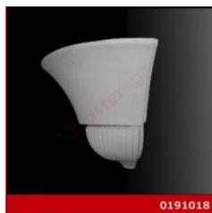
Cod. 0191018 - Lampada in gesso Lampada ad angolo in gesso alabastrino rinforzato.