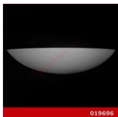
Cod. 019696 - Lampada in gesso Lampada da parete in gesso alabastrino rinforzato.