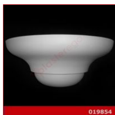
Cod. 019854 - Lampada in gesso Lampada in gesso alabastrino rinforzato.