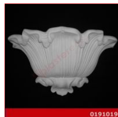
Cod. 0191019 - Lampada in gesso Lampada decorata in gesso alabastrino rinforzato.