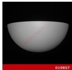
Cod. 019857 - Lampada in gesso Lampada in gesso alabastrino rinforzato.