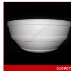
Cod. 019907 - Lampada in gesso Lampada in gesso alabastrino rinforzato.