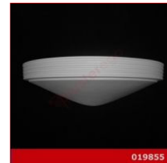
Cod. 019855 - Lampada in gesso Lampada in gesso alabastrino rinforzato.