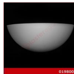
Cod. 019800 - Lampada in gesso Lampada da parete in gesso alabastrino rinforzato.