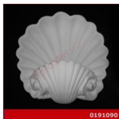
Cod. 0191090 - Lampada in gesso Lampada decorata da parete in gesso alabastrino rinforzato.