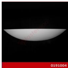
Cod. 0191004 - Lampada in gesso Lampada in gesso alabastrino rinforzato.

Ordina per: [Importanza] | Codice modello