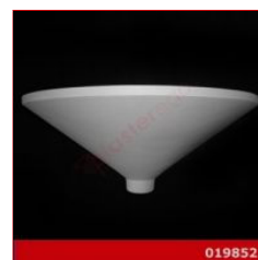
Cod. 019852 - Lampada in gesso Lampada in gesso alabastrino rinforzato.