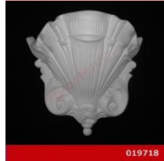
Cod. 019718 - Lampada in gesso Lampada decorata in gesso alabastrino rinforzato.

Ordina per: [Importanza] | Codice modello