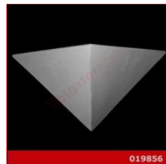
Cod. 019856 - Lampada in gesso Lampada in gesso alabastrino rinforzato.