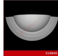
Cod. 019849 - Lampada in gesso Lampada in gesso alabastrino rinforzato.