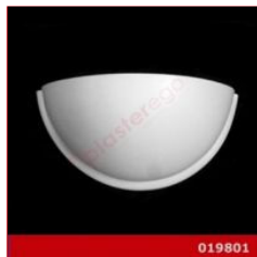
Cod. 019801 - Lampada in gesso Lampada in gesso alabastrino rinforzato.