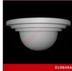
Cod. 019849A - Lampada in gesso Lampada in gesso alabastrino rinforzato.