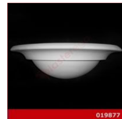
Cod. 019877 - Lampada in gesso Lampada in gesso alabastrino rinforzato.