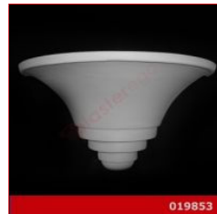
Cod. 019853 - Lampada in gesso Lampada in gesso alabastrino rinforzato.